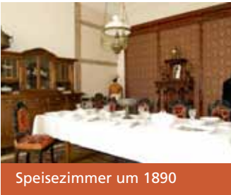
Speisezimmer um 1890

Die Geschichte des Salzgittergebietes in der Neuzeit präsentiert sich dem Besucher im ersten Obergeschoß des Schlosses mit einer breiten Palette von Ereignissen sowie Personen, die entscheidend für die Geschichte dieser Region gewesen sind. Man kann u. a. auf Wandermusikanten aus Salzgitter treffen, die im 19. Jahrhundert