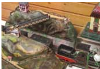
Spielzeug um 1900

Im zweiten Obergeschoss des Schlosses befindet sich eine der umfassendsten Dauerausstellungen zur Geschichte der Kindheit