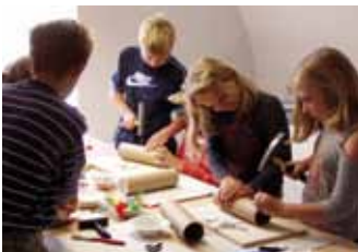
Bau von Regenmachern

Für Kindergartengruppen und Schulklassen aller Altersstufen halten wir ein umfangreiches Angebot aus verschiedenen Themenbereichen bereit: Bodenschätze in Salzgitter, Klima und Leben in der Steinzeit, Salzgitter im Mittelalter, Schule früher, Entwicklung von Landwirtschaft und Technik, vom Erz zum Stahl, Mobilität, Energie, barockes Leben im Schloss, Bildende Kunst.