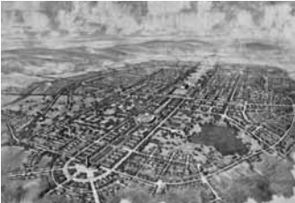
Plan der „Hermann Göring – Stadt“

Die Stadt Salzgitte wurde am 1. April 1942 mitten im Zweiten Weltkrieg gegründet. Im Rahmen ihrer Autarkiepolitik beschlossen die Nationalsozialisten, die im nördlichen Vorharzland anstehenden Erzvorkommen zu heben und zu verhütten. Am 15. Juli 1937 wurden zu diesem Zweck die Reichswerke gegründet. Tausende von Menschen strömten in das größte Aufbaugesamt des Dritten Reichs, Bauarbeiter, Bergleute, Ingenieure. Sie kamen aus Deutschland, aus mit Hitler-Deutschland befreundeten Staaten. Um diese Fachkräfte im Salzgittegebiet zu halten, wurde die Stadt Watenstedt-Salzgitte (seit 1951 nur noch Salzgitte) am 1. April 1942 per Gesetz gegründet. Nachdem Deutschland am 1. September 1939 den Zweiten Weltkrieg angezettelt hatte, wurden Kriegsgefangene eingesetzt, auch Zwangsarbeiter(innen) aus den von Deutschland besetzten Ländern und seit 1942 KZ-Häftlinge.