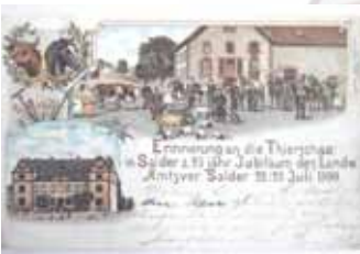
Schloss und Domäne 1899

Erbprinz August Wilhelm wollte das Schloss als Sommerresidenz nutzen. Wenige Jahre nach seinem Tod im Jahre 1731 wurde das Schloss durch Herzog Karl I. 1740 den herzoglichen Domänen zugeordnet.