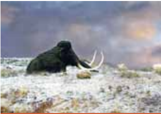
Mammut im Eiszeitgarten

Die ersten „Salzgitteraner“ lebten schon in der Eiszeit hier: Vor 50.000 Jahren schlugen sie an der Krähenriede ihr Lager auf. Von hier aus gingen sie auf die Jagd nach Rentieren. Gezielt erlegten sie die Tiere, um an das nahrhafte Knochenmark sowie an Häute zu gelangen. Aufgesammelte Mammutknochen wurden zu Knochengeräten weiterverarbeitet und Werkzeuge aus Feuerstein hergestellt. In der Dauerausstellung im Schloss wird das Leben der Neandertaler im eiszeitlichen Klima thematisiert.